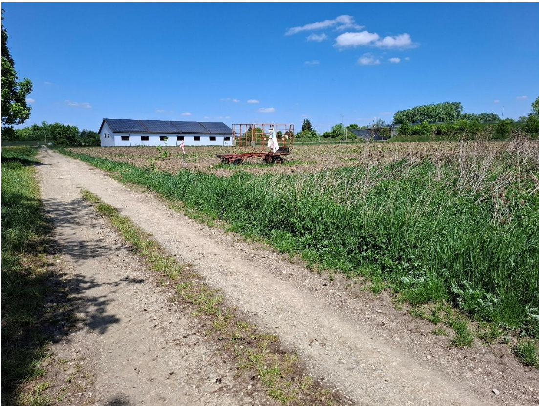
Blick von Südwesten über das Planungsgebiet, im Süden angrenzende Ackerbrache

Im Süden des Geltungsbereichs ist eine Ackerbrache (A 2, 5 WP, 8.951 m 2 ) ausgeprägt. In diesem Bereich existiert außerdem ein kleines Laubgehölz aus überwiegend Hasel (B 112, 10 WP, 231 m 2 durch Überbauung betroffen), das teilweise im Randbereich (geplante Grünfläche) erhalten werden kann. Schließlich liegen noch in geringem Umfang artenarme Grasfluren innerhalb des Änderungsbereichs (K 11, 4 WP, 225 m 2 ).