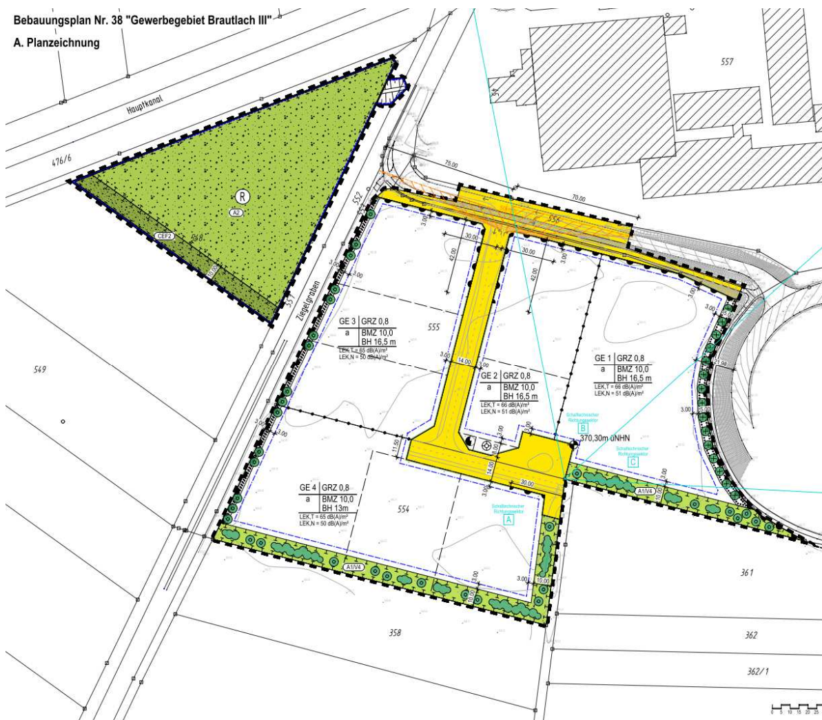
Abbildung 3: Planzeichnung des in Aufstellung befindlichen Bebauungsplans Nr. 38 „Gewerbegebiet Brautlach III“ der Gemeinde Karlskron, Stand 10.12.2018; Darstellung ohne Maßstab